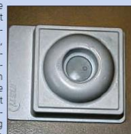
En moins d'une minute le test livre son résultat. Négatif : un rond ; positif : deux ronds.

pas comment les pharmaciens pourront prendre le temps de faire cette part nécessaire d'accompagnement et de