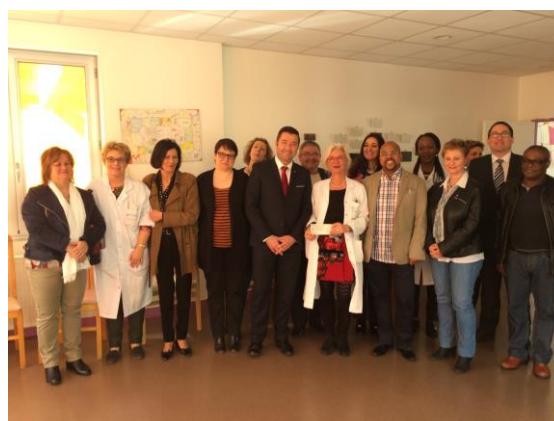
Photo : le 23 mars, une partie de la recette du tournoi de 2016 a été reversée à Re-Sources, l'association de l'EHPAD Hervieux. C'est la crèche qui bénéficiera de ce geste cette année.